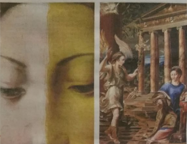
Tra i pezzi milanesi spiccano la Croce di Chiaravalle e la sinopia dell'affresco giottesco della chiesa di San Gottardo

Il Cavaliere Maraffioti, oltre pietra struttura del cinque secolo veneto. Cristo che so- sta, la bella mostra di cui si racconta al Palazzo di Brera nel museo archeologico di Biogio Caldesi, in una bella e spaziosa stanza tutta sala centrale delle Gallerie d'Italia. I suoi dipinti fatti dalla mostra. La bellezza ri- trovata, di Carlo Bertelli e altri.